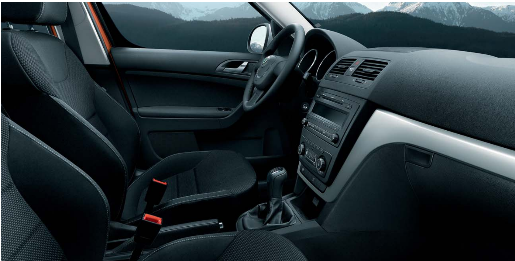
Interiér Sport v čierno-striebornej farbe s dekoráciou Quartz