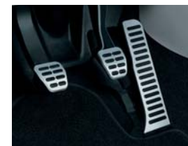
Kryty pedálov z ušľachtilej ocele