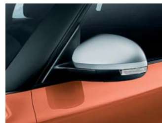
Dekoratívne kryty bočných zrkadiel – ALU dekor

Strešný nosič v čierno-striebornej úprave a SunSet – sklá s vyšším stupňom tónovania v zadnej časti vozidla